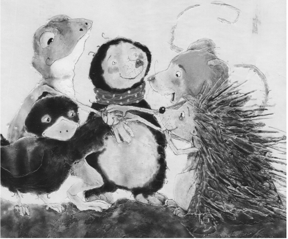
Brigitte Weninger / Eve Tharlet (Illustration), Einer für alle, alle für einen , Zürich 2022 – classic – mine-dition – S. 29.