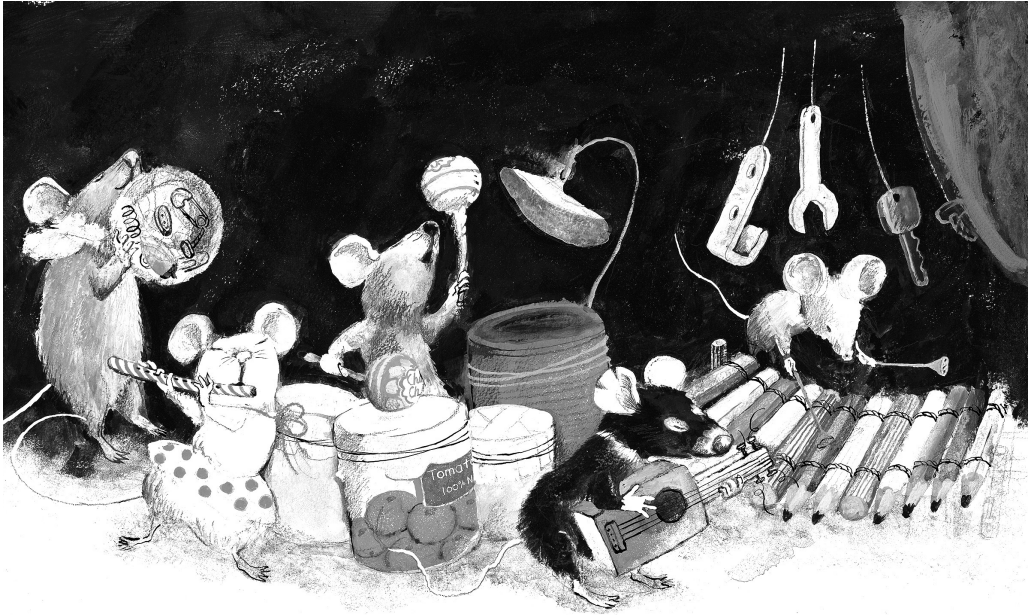
Chisato Tashiro, Fünf freche Mäuse machen Musik, Zürich 2020 – classic – miniedition – S. 22f.